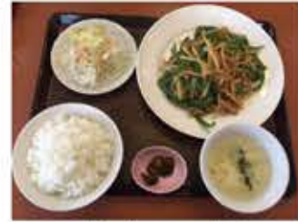
チンジャオロース定食

弊社から車で5分。中華料理のお店です。弊社スタッフもよくランチで利用させていただいています。メニューが豊富で、何を注文しようか悩んでしまいました。