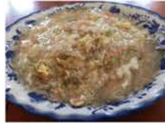
カニあんかけチャーハン